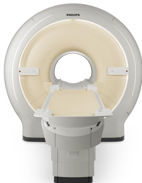
オランダ フィリップス社製 Ingenia 1.5T CX