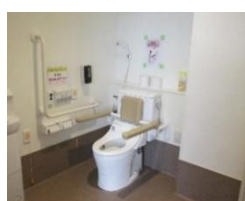
トイレ 各部屋の前に 設置しています