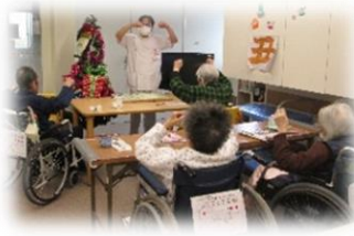
食事前の嚥下体操