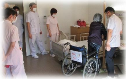
日常生活動作カンファ