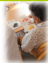
コミュニケーション 訓練