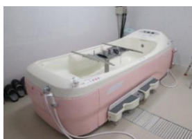
特殊浴槽 (バード浴)