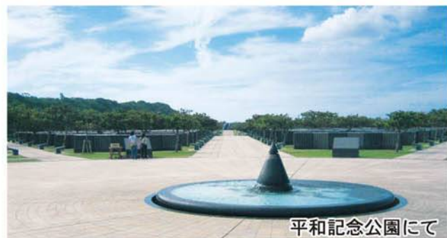
平和記念公園にて